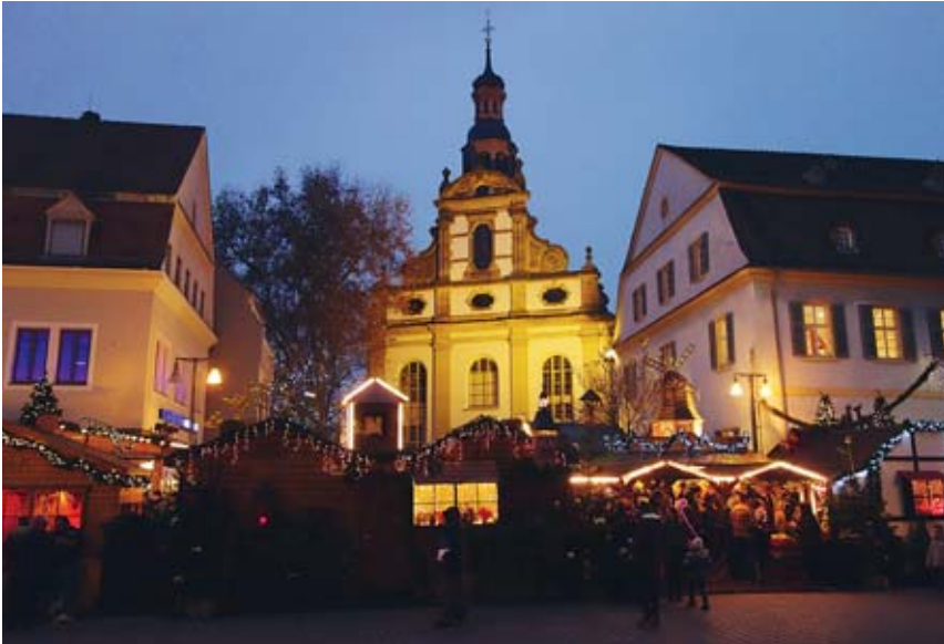
Adventliche Stimmung auf dem Weihnachtsmarkt.

GEMEINNÜTZIGE BAUGENOSSENSCHAFT SPEYER eG