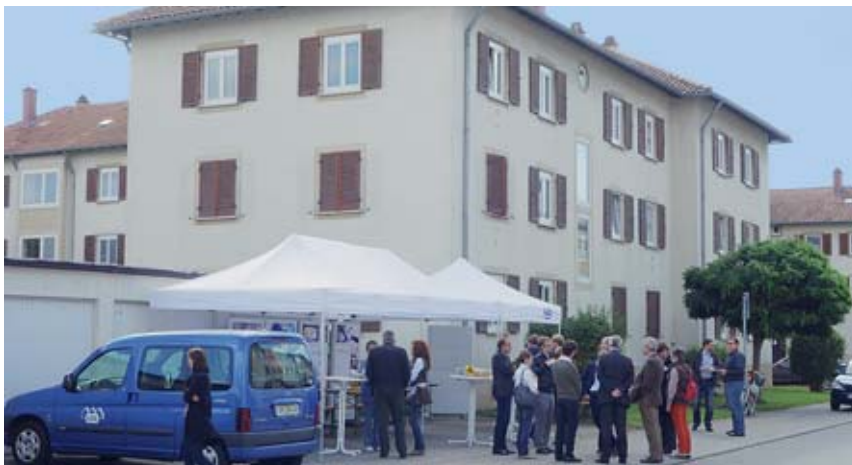
Vorstellung des Modellprojekts „Am Germansberg“.

Die Genossenschaft konnte dabei ihr Modellprojekt „Untersuchung zur Effizienz kybernetischer Sanierungskonzepte für 1950er-Jahre Siedlungswohnbauten – am Beispiel der Siedlung Am Germansberg“ den dort wohnenden Mieterinnen und Mietern sowie der Öffentlichkeit vorstellen. Viele Anregungen von Seiten der Bewohner wurden von der GBS mit Interesse aufgenommen.