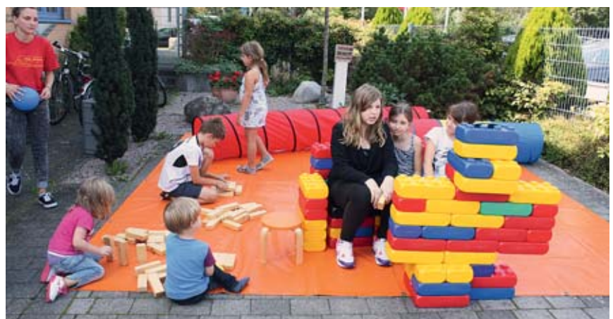
Die Betreuerinnen und Betreuer vom „Spieleflitzer“ hatten eine Spielecke für die jungen Baugenossinnen und Baugenossen eingerichtet.